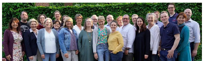
Gemischter Chor aus Rendsburg